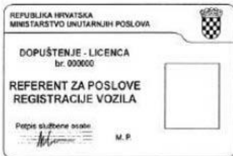
Početina obrasca 2